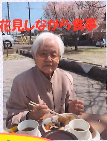
花見しながら食事