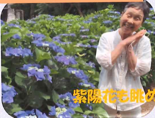
紫陽花も眺めも最高♪