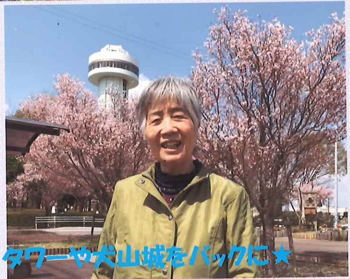
タワーや犬山城をバックに★