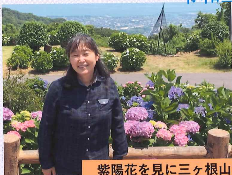
紫陽花を見に三ヶ根山へおでかけ