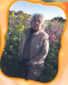
於大の道で綺麗な彼岸花が咲いていました