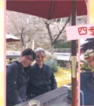
四季桜 満開でした😊